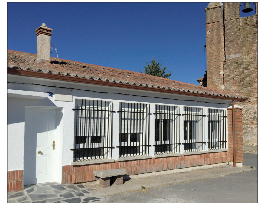
Rehabilitación de las antiguas escuelas.