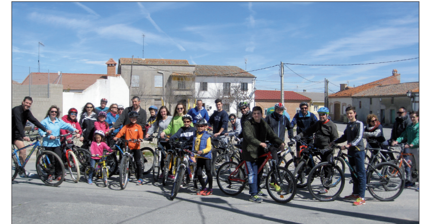
Ciclomarcha al Castillo de Castronuevo.