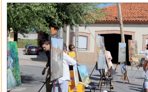
Certamen de pintura "Duque de Alba".