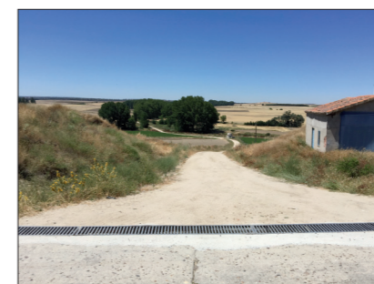
Reparación de caminos.