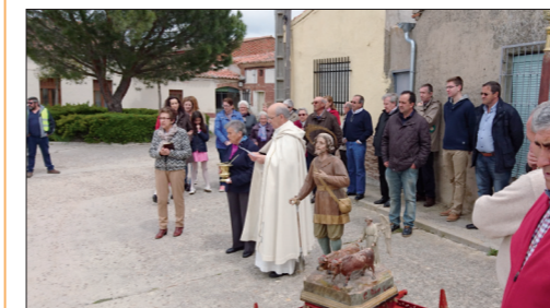
Procesión de la Fiesta de San Isidro.