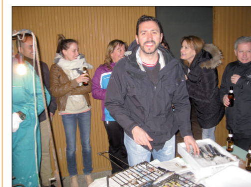
La tradicional sardinada de Semana Santa.