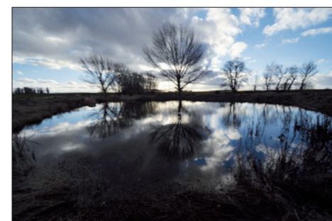
Concurso de fotografía.